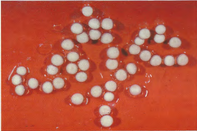
Abb. 1. Gelege von P. labiatus , bestehend aus 41 Eiern. Clutch of P. labiatus with 41 eggs.

Am 23.3. bei Wassertemperaturen von 9,5 °C fiel uns auf, daß sich ein Weibchen (13,4 cm Gesamtlänge) auch während der Fütterung nicht aus der Tonröhre bewegte. Bei einer Kontrolle am selben Tag stellten wir neun Eier fest, die dicht nebeneinander unter die Decke der Tonröhre gelegt worden waren. Um die Eier derart hoch zu plazieren, mußte sich das Weibchen mehr oder weniger kopfüber an der Röhrenwand bewegt haben. Während der nächsten 14 Tage (bis zum 6.4.) legte das Weibchen weitere 32 Eier, so daß das vorläufig endgültige Gelege 41 Eier umfaßte (Abb. 1).