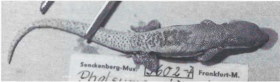
Abb. 2. Phelsuma lineata bifasciata (SMF 9602), Paralectotypus aus dem / paralectotype from the / Senckenberg-Museum Frankfurt/M.

mit P. lineata chloroscelis eine weitere Unterart von Phelsuma lineata . Zur Unterscheidung gegenüber der Nominatform wurde nicht nur die bedeutendere Größe und die fleckenlos grüne Färbung der Oberschenkel erwähnt, sondern besonders auch die Rückenzeichnung, die aus einem nach vorne scharf abgegrenzten roten Fleck besteht, der sich schwanzwärts in kleinere Flecken auflöst. Die Hinterbeine sind nicht grau und braun gefleckt wie bei der Nominatform, sondern einfarbig grün oder allenfalls grün mit spärlichen dunklen Fleckchen (Abb. 3).