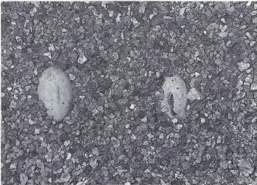
Abb. 2. Eier von Varanus storri , ein Ei angeschnitten. Eggs of Varanus storri , one egg opened.

Erst ein Jahr später, am 3. 2. 1983, legte das Weibchen, nachdem eine wie