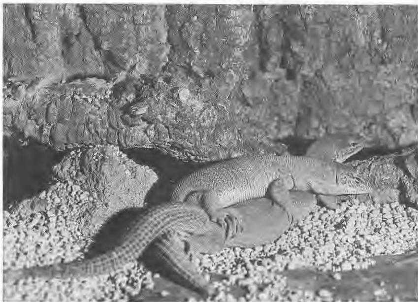
Abb. 1. Varanus storri in Kopula. Varanus storri mating.

Ursprünglich wurden 2,2 V. storri in einem Terrarium zusammen gepflegt. Leider war auch bei diesen Tieren die von anderen Pflegern beschriebene Unverträglichkeit festzustellen, so daß eines der männlichen Tiere im Jahr 1982 einging. Auch die Weibchen waren recht unverträglich untereinander, so daß es geraten schien, eines der Weibchen zu separieren. Das verbliebene Pärchen erhielt ein Terrarium mit den Maßen 90 × 40 × 30 cm (Länge × Breite × Höhe). Als Bodengrund diente Katzenstreu, das die Tiere offenbar nicht als „unnatürlich“ empfanden. Dieser Bodengrund bietet mehrere Vorteile: Einmal wird hierdurch der Kot der Tiere schnell und geruchlos gebunden, und zum anderen kann man — für eine eventuelle Eiablage — eine Ecke des Terrariums feucht halten, ohne daß der gesamte Boden feucht wird. Eine Schieferplatte (20 × 10 cm) wird durch eine Bodenheizung erwärmt. Etwa 20 cm über dieser