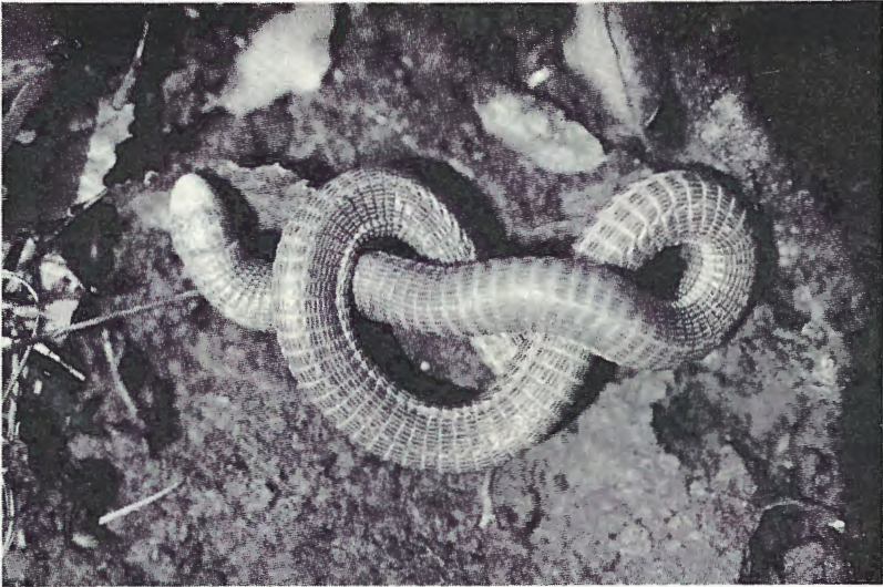
Abb. 2. Blanus cinereus in Achterschleife. Portalegre (Fundpunkt 8).

Zweifellos stellt dieses Verhalten eine Ausnahme-Erscheinung dar. Die extrem subterrane Wöhle steigt in Portugal mit der im Oktober/November einsetzenden Regenzeit in die obersten Bodenschichten, wo sie sich dann tagsüber mit Vorliebe unter flach aufliegenden Steinen aufhält. Ihr Aktivitätsmaximum scheint sie in dieser Zone zwischen März und Mai zu entfalten, um im Sommer wieder in tiefere Schichten zu wandern. Nur nachts begibt sie sich, das Gelände nach Nahrung absuchend, auch an die Oberfläche, wie mir dies zahlreiche Terrarienbeobachtungen bestätigten.