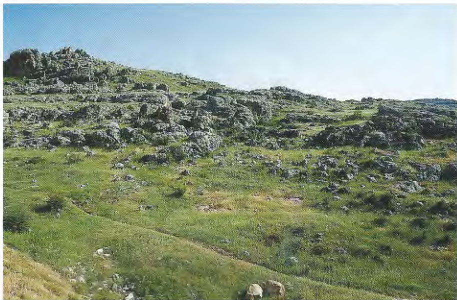
Abb. 3. Lebensraum von Rhinotyphlops sp. bei Halfeti (500 m, Prov. Şanlıurfa, Türkei). Habitat of Rhinotyphlops sp. near Halfeti (500 m, Şanlıurfa prov., Turkey).

angegeben: DISI 1987, WERNER 1988) konnten an der Fundstelle nicht nachgewiesen werden. Zumindest für Chamaeleo chamaeleon , dessen östlichster bisher bekannter Verbreitungspunkt in der Südosttürkei bei Birecik liegt („five km north of Birecik“, mutmaßlich ebenfalls im Euphrattal: BARAN et al. 1988, vgl. auch SCHNEIDER et al. 1991), ist aber ein Vorkommen in unmittelbarer Umgebung der Rhinotyphlops -Fundstelle zu erwarten. Das Auftreten einzelner mediterraner Arten bei Halfeti erklärt sich möglicherweise durch eine lokalklimatische Sondersituation im Euphrattal, das im Vergleich zur Umgebung insgesamt ausgeglichene Feuchtigkeitsverhältnisse aufweist. Dafür sprechen die relativ üppige Vegetation, das zumindest saisonale Vorhandensein kleinerer Quellen und Feuchtstellen im Hang sowie ausgedehnte Oliven- und Feigenkulturen direkt unterhalb der Fundstelle. Unter anderem werden Olivenbäume ( Olea europaea ) und Feigen ( Ficus carica ) von MAYER & AKSOY (1986: 177) als mediterrane Relikte aufgeführt, die in der südostanatolisch-mesopotamischen Steppenregion vereinzelt östlich bis in den Raum Urfa/Diyarbakır auftreten.