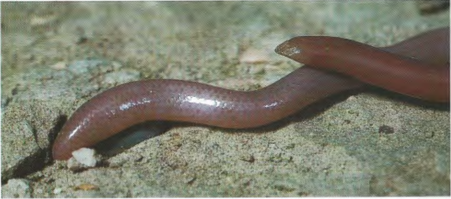
Abb. 1. Porträt von Rhinotyphlops sp. von SO Halfeti (Prov. Şanlıurfa, Türkei). Portrait of Rhinotyphlops sp. from SE of Halfeti (Şanlıurfa prov., Turkey).