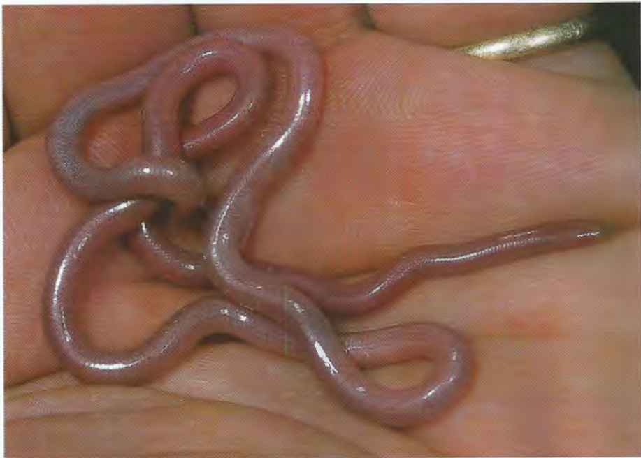
Abb. 2. Rhinotyphlops sp. von SO Halfeti (Prov. Şanlıurfa, Türkei). Rhinotyphlops sp. from SE of Halfeti (Şanlıurfa prov., Turkey).