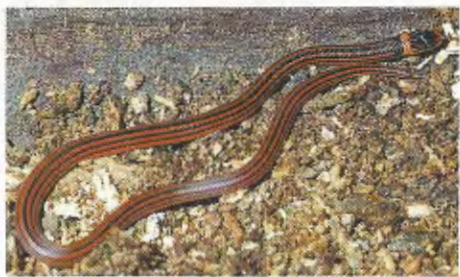
Abb. 2. Jungtier von Polemon acanthias mit charakteristischer Zeichnung.

Thelotornis kirtlandii (HALLOWELL, 1844); SMNS 9232, ZFMK 1 Tier. SMNS 9232 fingen wir tags am 12.9.1997 auf dem Mont Niénokoué. Auf diesem Inselberg hatte die Schlange, auf einem kleinen Busch am Rande eines Waldstücks liegend, eine adulte Mabuya affinis erbeutet, die 10 Minuten, nachdem sie wieder ausgewürgt worden war, verstarb. LUISELLI et al. (1998) fanden gleichfalls Echsen als Beute. Weitere Arbeiten zum Beutespektrum dieser Art zitieren RIQUEIR & BÖHME (1996). Wie deren Exemplare besaß auch unsere Lianennatter schwarz gesprenkelte Oberlip-