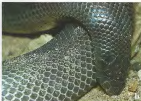
Abb. 3 a & b. Atractaspis corpulenta ; a) beachte die charakteristische weiße Schwanzspitze, b) typische Kopfhaltung eines sich bedroht fühlenden Tieres.

Atractaspis corpulenta ; a) characteristic white tail tip, b) typical head posture of a threatened animal.