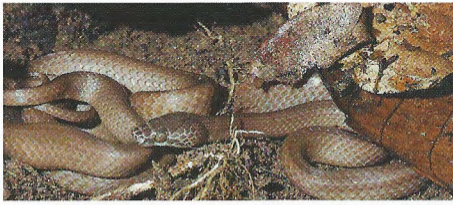
Abb. 1. Hormonotus modestus ist eine häufige „Hausschlange“ des Tai-Nationalparks und seiner Umgebung.

Hormonotus modestus is one of the most common „house snakes“ in Tai National Park and its surroundings.