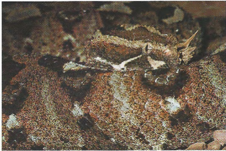
Abb. 5. Porträt einer adulten Bitis nasicornis aus dem Tai-Nationalpark.

Bitis nasicornis (SHAW, 1802); Photobelege (Abb. 5). Mehrere Photonachweise belegen das Vorkommen der Nashornviper im TNP, die bei Sebso auch mehrfach von Holzfällern gefangen und als „Haustier“ gehalten wurde. Wir wurden am 19.3.1999 von ivorischen Mitarbeitern eines Affenprojektes zu einer circa 1,50 m langen Nashornviper geführt. Die Schlange sonnte sich in einem sumpfigen Primärwald völlig offen auf einer trockenen, sandigen Stelle zwischen kleineren Palmen und Palmstrünken. Das Tier wurde von unserem Führer sowohl am Vortag als auch eine Woche davor an genau derselben Stelle angetroffen. Diese zweite große Viper der Region scheint auf den Regenwald (HUGHES & BARRY 1969, HUGHES 1988) und dort auf sumpfige Abschnitte beschränkt zu sein (LUISELLI & AKANI 1999).