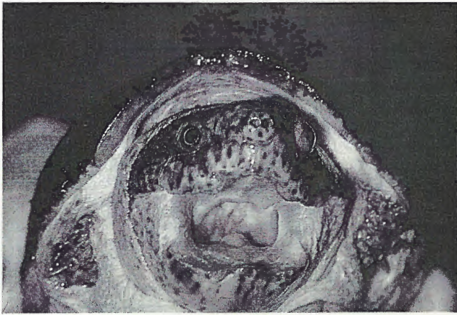
Abb. 2. Kopf eines alten Sternotherus m. minor ♂ mit breiten Beißflächen der Kiefer. Kopfbreite 39 mm.

und Garnelen ( Crangon und Palaemon ) Rechnung getragen. Als grober Anhaltspunkt für die Menge sei angegeben, daß das ♂ einmal pro Woche 7 bis 10 ml Futter erhielt, das ♀ auf zwei- bis dreimal in der Woche verteilt bis zur doppelten Menge. Dieses Vorgehen bezieht sich aber keineswegs allein auf die Produktion von Eiern, sondern darauf, daß das weibliche Tier durch die Gemeinschaftshaltung einem weit höheren Energieverbrauch unterlag.