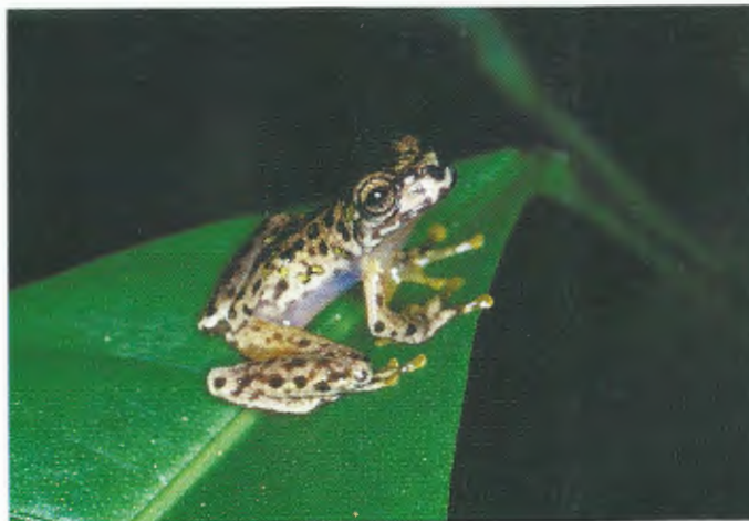
Abb. 14. Plectrohyla sp., eine endemische Froschart vom Cerro Saslaya. Plectrohyla sp., an endemic frog species from Cerro Saslaya.