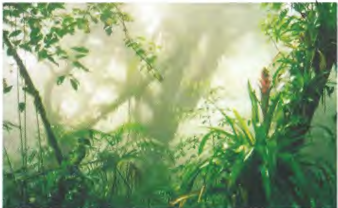
Abb. 11. „Elfenwald“ auf dem Volcán Mombacho (1100 m NN). “Elfin forest“ of Volcán Mombacho (1100 m above sea level).