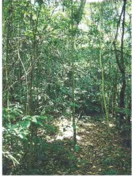
Abb. 9. Regenwald von Selva Negra. Rain forest of Selva Negra.