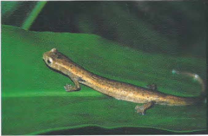
Abb. 12. Bolitoglossa mombachoensis ist endemisch für den Volcán Mombacho. Bolitoglossa mombachoensis is endemic to Volcán Mombacho.