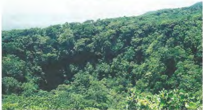
Abb. 10. Blick auf Krater des Volcán Mombacho (1100 m NN). View of crater of Volcán Mombacho (1100 m above sea level).