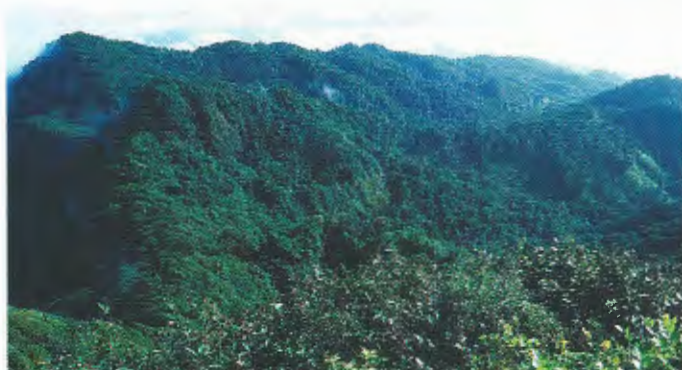
Abb. 2. Blick auf den Nebelwald des Cerro Kilambé.

1: Cerro Kilambé; 2: Cerro Saslaya; 3: Miraflores; 4: Selva Negra; 5: Volcán Mombacho.