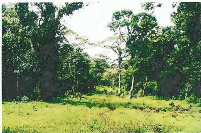
Abb. 6. Fragmentierter Bergregenwald in Miraflor (1190 m NN).

Fragmented montane rain forest at Miraflor (1190 m above sea level).