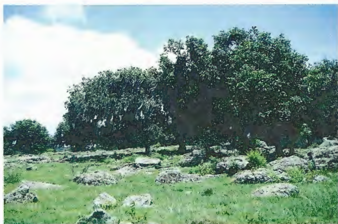
Abb. 7. Eichenwald in Miraflor.

Fragmented montane rain forest at Miraflor (1190 m above sea level).