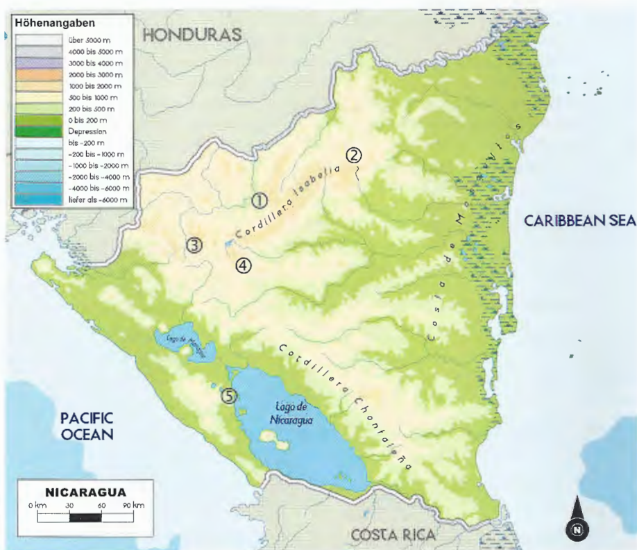
Abb. 1. Karte von Nicaragua mit den Untersuchungsgebieten.

2. Trockenadaptierte Arten: In diese Herpetofaungemeinschaft werden Arten eingeteilt, die vorwiegend an Halbtrockenwälder eines wechselfeuchten Klimas angepasst sind, das durch eine vier- bis sechsmonatige Trockenzeit charakterisiert ist (z. B. Bufo luetkenii BOULENGER, 1891, Hypopachus variolosus (COPE, 1866), Ctenosaura similis ).