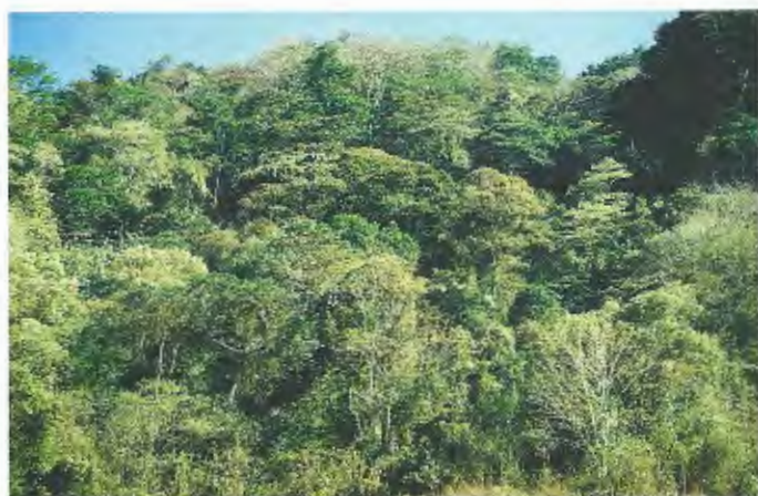
Abb. 8. Blick auf den Bergregenwald von Selva Negra.

Oak forest at Miraflor.