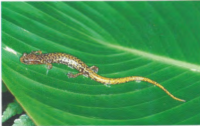
Abb. 13. Der ende- mische Salamander Nototriton saslaya vom Cerro Saslaya. The endemic salamander Nototriton saslaya from Cerro Saslaya.