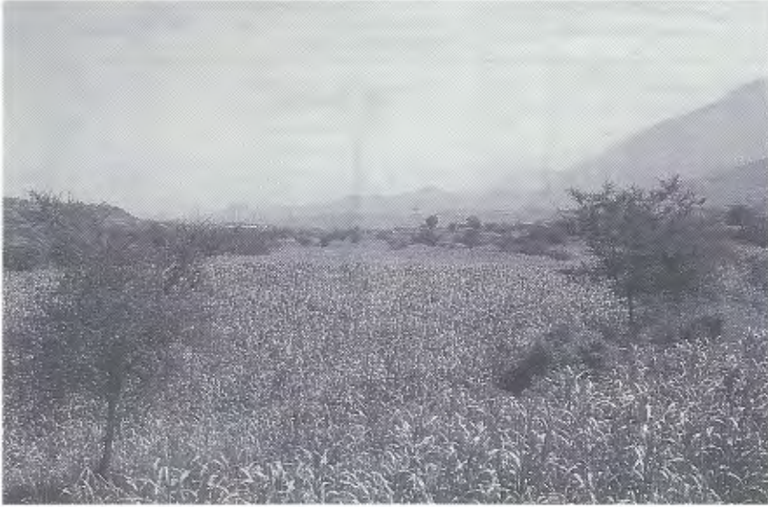
Abb. 3. Kulturlandschaft in der Nähe von Ibb. Sorghum-Felder mit vereinzelt Akazien. Biotop von C. c. calyptratus .

Cultivated area near Ibb. Sorghum fields with isolated Acacia trees. Environment of C. c. calyptratus .