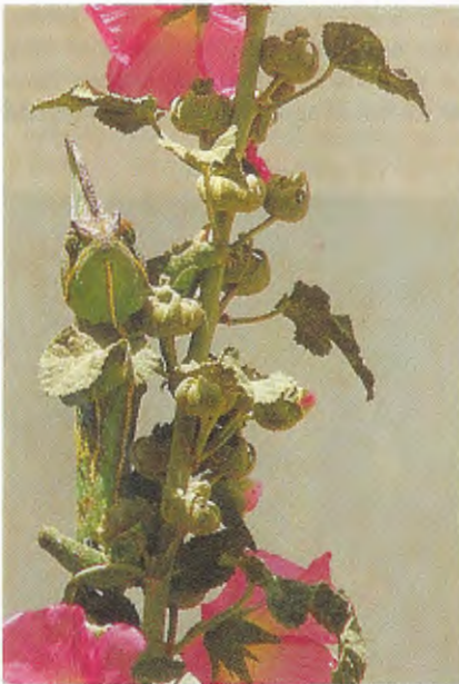
Abb. 2. Chamaeleo c. calyptratus , dasselbe Männchen wie in Abb. 1, versucht, sich hinter dem Trieb einer Malve zu verstecken.

zurückzufahren, und diesmal ließen wir uns in Ibb nieder. Hier sahen wir nochmals 7 Tiere und weitere 10 vom Autobus aus. Während unserer Suche fiel uns auf, daß die Chamäleons sehr scheu waren. Schon bei einer Entfernung von 30 m reagierten sie und verschwanden hinter einem Ast (Abb. 2). Dieses Verhalten erschwerte das Fotografieren der Tiere sehr und erklärte vielleicht auch, weshalb wir zu Fuß so wenig Tiere entdecken konnten. Später konnten wir feststellen, daß C. c. calyptratus nicht nur in der regenreichen Umgebung von Ta'izz und Ibb vorkommt, sondern auch auf der trockenen Hochebene rings um Dhamar.