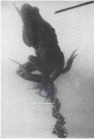
Abb. 2. Die Eiablage. The deposition of the egg-string.

Das Weibchen drehte sich während der Eiablage nicht um das Ästchen, sondern kletterte in einer geraden Linie hoch. Das Gelege drehte sich also auch nicht um das Ästchen, sondern wurde rechts und links um das Ästchen geschoben. In Abbildung 3 ist die Eiablage schematisch wiedergegeben. Nach dem Anschwellen der Gelatine klebt die Laichschnur fest am Ästchen. Auf den ersten Blick sieht es tatsächlich so aus, als ob die Laichschnur schraubenförmig gewickelt wäre; daher ist die bisherige falsche Beschreibung der Eiablage verständlich.