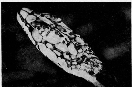
Abb. 3 Kopf der in Abb. 1 dargestellten Thelotornis kirtlandii capensis etwa 4 Wochen nach Entfernung des Akaziendornes. Das linke Auge blieb blind.

Vier Wochen später häutete die Natter. Das linke Auge blieb allerdings blind.