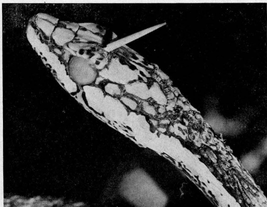
Abb. 1 Thelotornis kirtlandii capensis . Der durch den Oberkopf gedrungene 17 mm lange Akaziendorn führte zur Erblindung des linken Auges.

Thelotornis kirtlandii capensis . 17 mm long thorn of an acacia caused blindness of the left eye, by penetrating the upper part of the head.